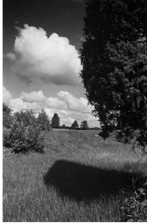
ALGIMANTAS KUNČIUS Niūronys (Reminiscenčių ciklas), 1984 nespalvota fotografija