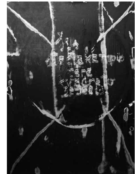
LINAS KATINAS Šis stačiakampis tėra kvadrato šešėlis, 2011 akrilas, aliejiniai dažai, fanera, 115 x 150 cm

LK: Ir žinot, aš bandžiau suprasti apie ką mes kalbėjome, bet mano galvoje buvo visiškai tuštuma.