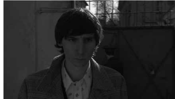
DEIMANTAS NARKEVIČIUS Uždrausti jausmai , 2011 HD videofilmas, 45'

DN: Sistemos ir individo santykiuose neišvengiamai užkoduotas absurdas ir absurdiškos situacijos. Šioje srityje nemažai pasidaravo tarybinė sistema – iki šiol apie ją pasakojami anekdotai. Pagrindinė tarybinių anekdotų tema – beteisio žmogaus santykis su sistema arba jėgos struktūromis. Tai sąlygojo itin absurdiškas situacijas. Tuo tarpu kalbėti apie dabartinę teisinę aplinką nėra linksma. Mes visi įgavome daugiau pilietinių teisių, tik galbūt neišmokome jomis naudotis – bet tai nejuokinga.