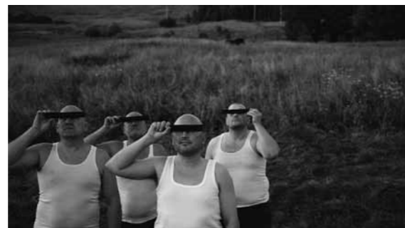
ALGIS GRIŠKEVIČIUS Užtemimas, 2009 tonuota fotografija, 56 x 100 cm

AG: Taip, fotografija pakeitė mano tapybą. Kadangi fotografijoje kuriu siužetus, istorijas, tai tapyba visiškai išsigrynino. Vienu metu mano tapyboje buvo per daug literatūros, o dabar fotografijos pagalba pavyko nuo jos išsivaduoti. Tapyboje nekūriau tokių siužetų, kokius dabar matote nuotraukose, bet ėjau to link. Tačiau fotografijoje tai paveikiau, nes šiai medijai tokie pasakojimai nėra būdingi. Šiaip fotografija mano gyvenime atsirado dėl to, kad vienu metu tapyba man ėmė virsti amatu, kuris atliekamas iš inercijos, o tapyba reikalauja tiesioginės energijos įkrovos, kurios kartais pritrūksta – be jos tapybos darbas netenka gylio. O dabar viskas susidėliojo idealiai – visą vasarą tik fotografuoju, bet rudens link jau labai pasiilgstu tapybos. Galų gale, ne taip svarbu, kokias išraiškos priemones pasirenki – kad tik turėtum, ką pasakyti.