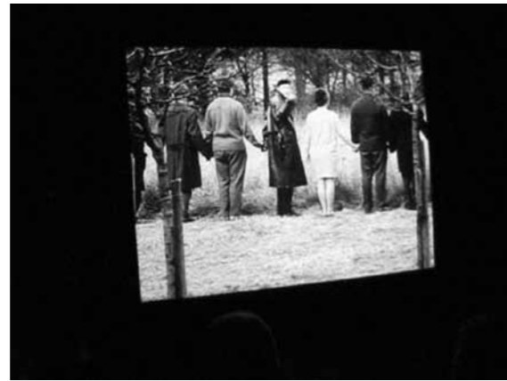
Jano Svankmajerio filmo Sodas (1968) projekcija Danijos paviljone 54-oje Venecijos bienalėje. Dainiaus Liškevičiaus kadras.

JOLITA LIŠKEVIČIENĖ — DAINIUS LIŠKEVIČIUS