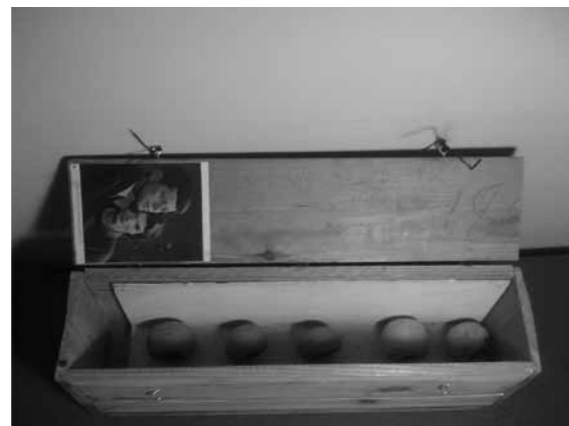
GEDIMINAS AKSTINAS Mokiniai , 5-6 klasė, 2005 medis, suodžiai, 12 x 8.5 x 39 cm

Žinot, aš labai negatyviai šneku, bet šiaip viskas yra gerai.